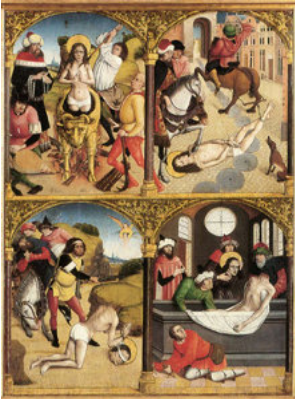
San Sebastián (III. mendea)

Igandea, 2011(e)ko urtarrila(r)en 16-(e)an 12:50etan - Azken eguneratzea Asteartea, 2011(e)ko uztaila(r)en 19-(e)an 18:34etan